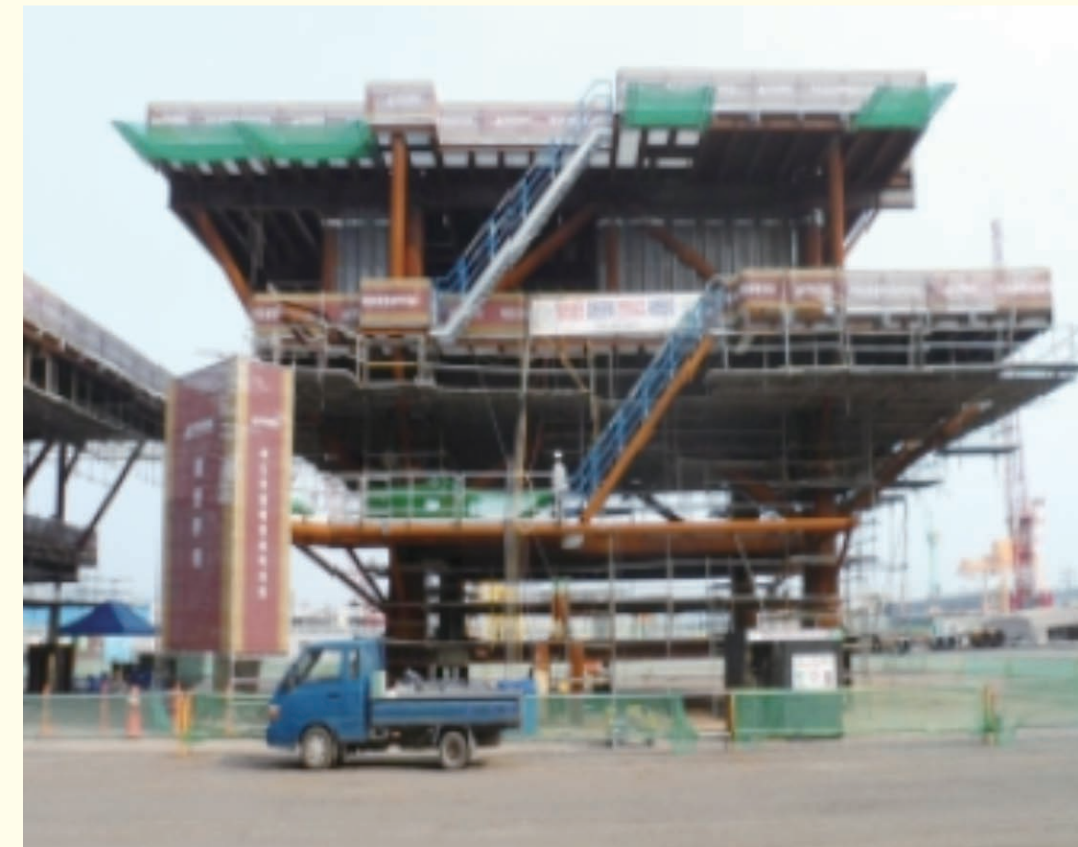
製作中の独島海洋科学基地の構造物 全羅南道麗水の栗村団地 2012年7月23日