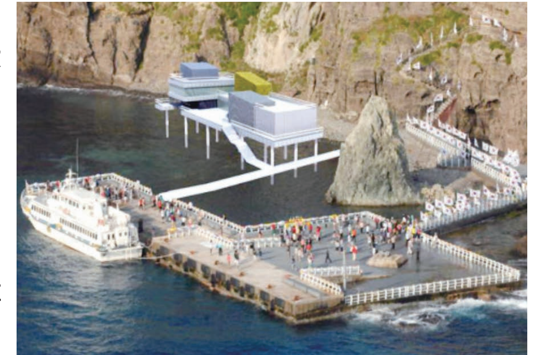
現場管理事務所予定図画像（2011年9月6日）