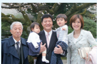
靖国神社にお宮参り

家に戻れば妻とともに80歳の父と暮らし、30歳、5歳、3歳のかわいい子供たちのよき父親となります。そして愛犬、金魚、植物たちの面倒もみています。