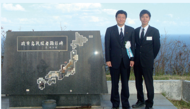
硫黄島慰霊祭にて