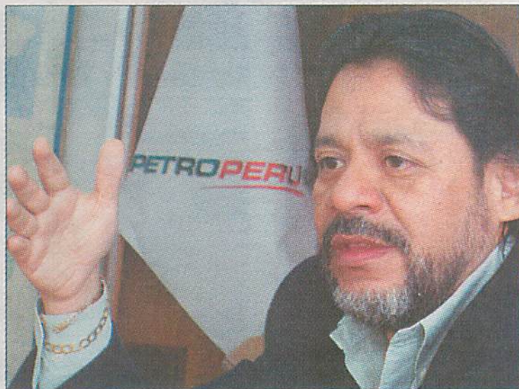
César Gutiérrez, presidente de Petroperú.

Puntos medulares de esta reforma son: la reducción del plazo para la devolución de los recursos a las refinerías, actualmente de un año en un contexto en que el crudo se dispara día a día y la