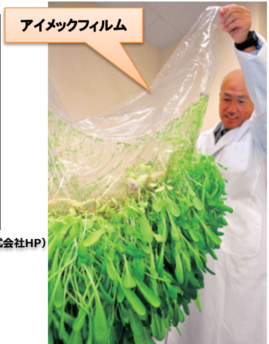
フィルムに張り付いた植物の根