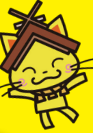
島根県観光キャラクター「しまぼっと」 島根県設計課第5171号