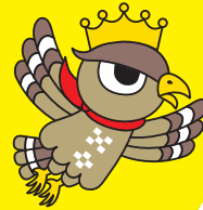
石垣市公設キャラクター「いちーぐる」