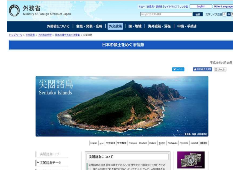
外務省ホームページ