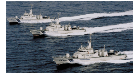
警戒監視中の海保庁巡視船