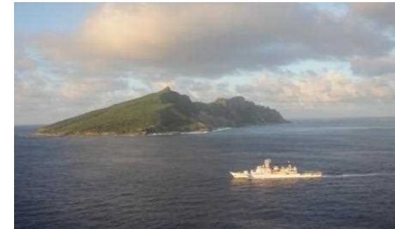
警戒監視中の海保庁巡視船(後ろは魚釣島)