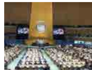
第69回国連総会第80回本会議の様様