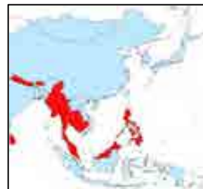
アジア地域の世界測地系の採用状況 (水色:採用、赤:未採用、白:不明)