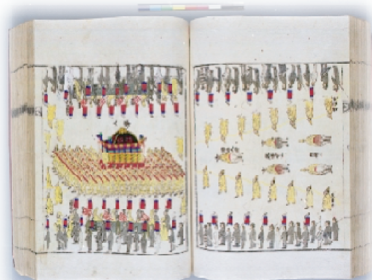
明成皇后国葬都監儀軌